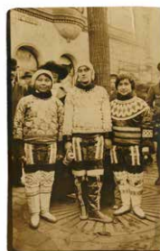
Postkort sign. af Tante Grønland ved børnehjælpsdagen i 1922.