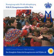
Souvenirmappe 01303097 H.K.H. Kronprinsessen 50 år. Mælkebøttecenteret 05.02.2022. DKK 76,00