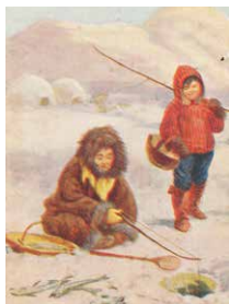
Postkort fra ca. 1915 viser kvindelig storfanger og barn på fisketur (udgiver SPCK England).

Kaptajn Ejnar Mikkelsen var samtidig stærkt bekymret for, hvordan forhandlingsresultatet med Norge ville blive. Den 10. juli 1924 indgik man Østgrønlands Overenskomsten med Norge. Den var gældende i 20 år. Norge accepterede, at Angmassalik Distrikt var