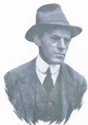
Scoresby-Sund Ekspeditionens Leder: Kapt. Ejnar Mikkelsen.

Til Grønlandsfesten i Tivoli i 1924 fremstillede man det viste hæfte indeholdende 28 sider med reklame for Scoresby Sund Ekspeditionen, og en række arrangementer relateret til Grønland, i og udenfor Tivoli. Fotoet af Ejnar Mikkelsen stammer fra hæftet.